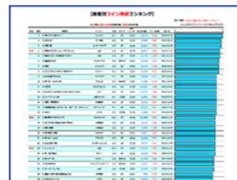
コイン単価ランキング▶