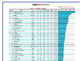
台数別稼働率ランキング▶