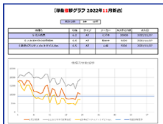
新機種稼働推移グラフ▶