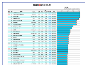
機種別稼働率ランキング▶